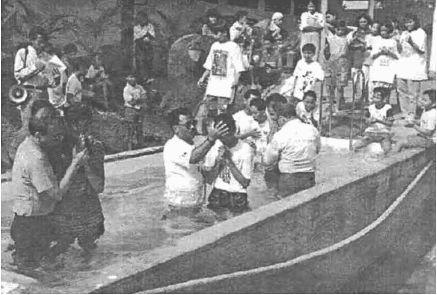
Para peserta Pemkhus XVII '96 sedang dibaptis di Kalam Arauna.