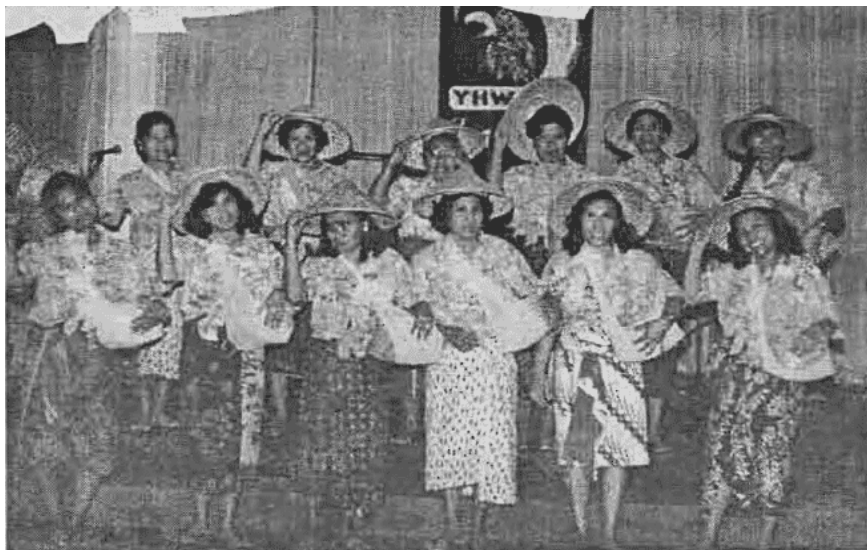
Tampak Ibu-ibu LBTC sedang menari, ikut memeriahkan acara Pembukaan "Reuni & 25th LBTC".