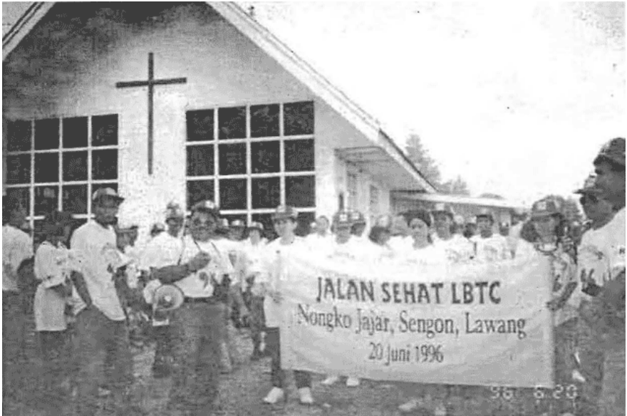
"Jalan Sehat" LBTC, start dari GKB Nortgkojajar, menempuh perjalanan sepanjang 10 km.