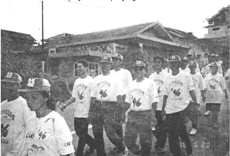
Para peserta "Jalan Sehat".