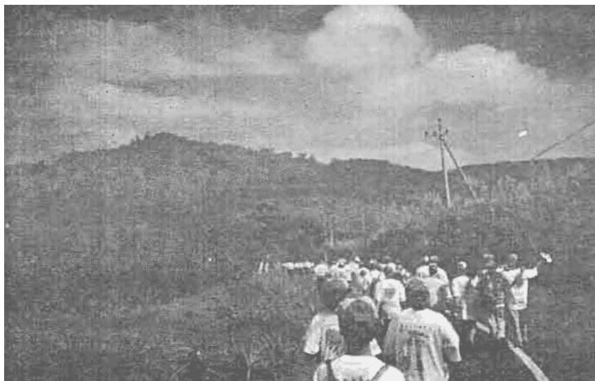
Teriknya mentari siang, tidak mengurangi semangat para peserta "Jalan Sehat" ...