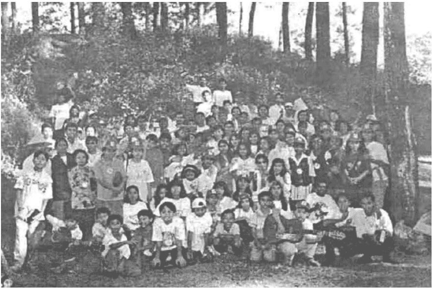
Para peserta Pemkhus XVII '96 waktu K-3 di hutan Pinus-Lawang.