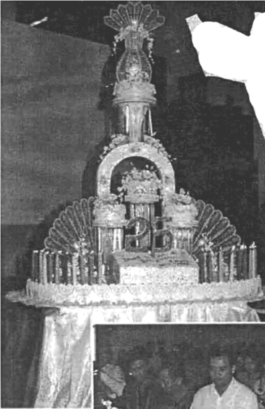
Kue Tart "25 th L B T C" memberi warna tersendiri.